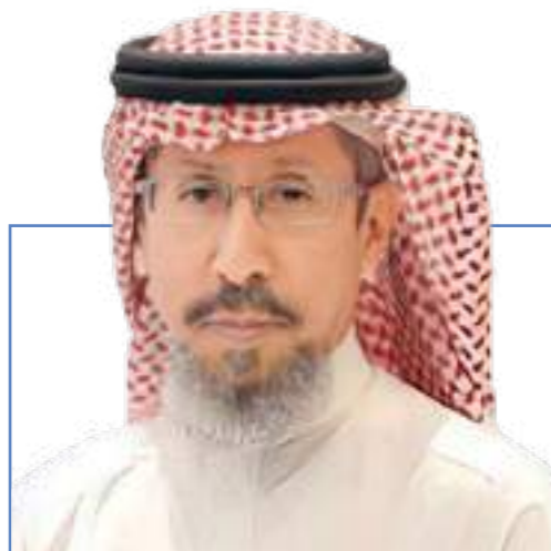
سعادة الأستاذ سليمان بن عبدالعزيز الحصين - رئيس مجلس أمناء مؤسسة صندوق موظفي (سابق) الخيري (بر)